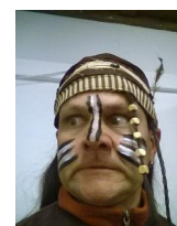
Euer OLD EAGLE